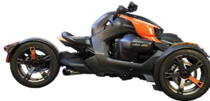
Can-Am Ryker 900